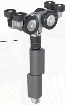
Rollapparate mit 8 Rollen aus Edelstahl 316L