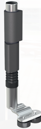
Bodenführung aus Edelstahl 316L